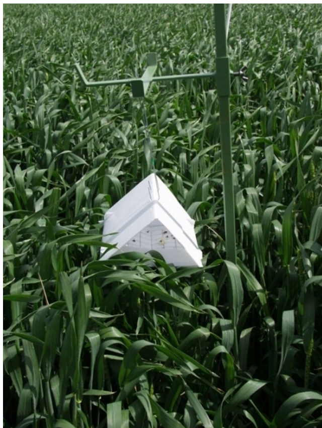
Billede 5. Feromonfælde til at følge forekomsten af orange-gule hvedegalmyg.