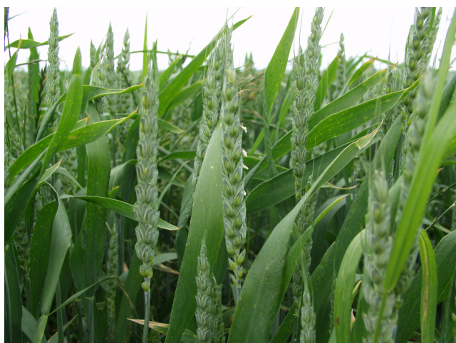
Billede 6. De første småaks er afblomstrede og er ikke længere modtagelige. Dette ses let ved at støvknapperne hænger ud.

Kontakt din lokale rådgivningsvirksomhed , hvis du vil vide mere om dette emne.