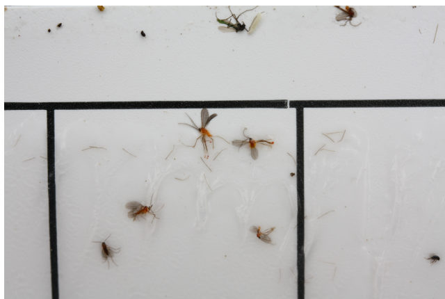
Billede 4. Limplade fra feromonfælde med orangegule hvedegalmyg. Fælderne tiltrækker kun orangegule hvedegalmyg, men andre insekter kan tilfældigvis komme til at klistre på fælden.