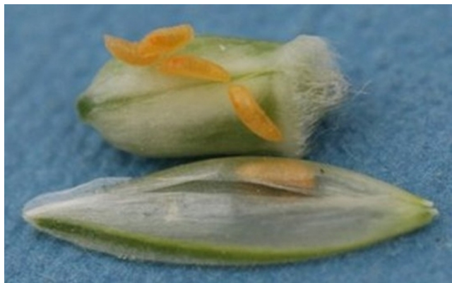
Billede 2. Larver af orange-gule hvedegalmyg på hvedekerner. I den ene kerne kan der skimtes en larve under avnen. Larverne kan findes i aksene omkring de tre første uger af juli.